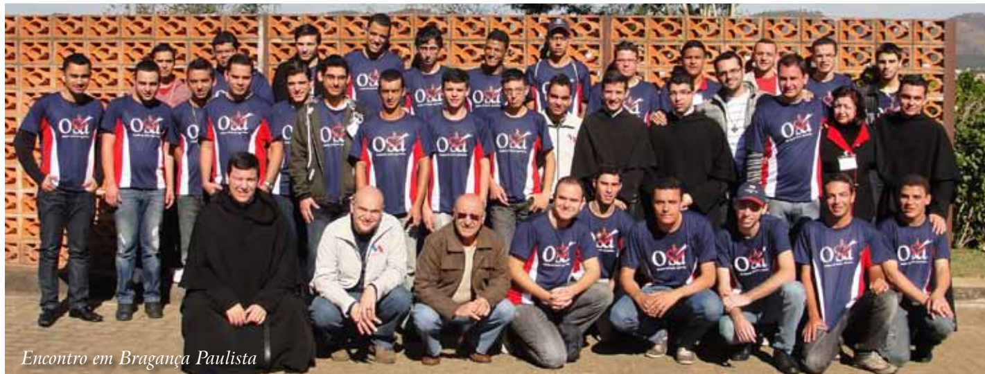
Encontro em Bragança Paulista